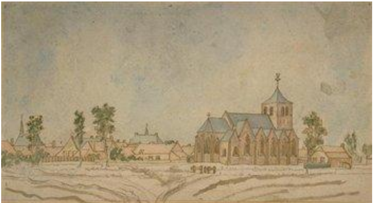
Budel vanuit het Noorden in 1829