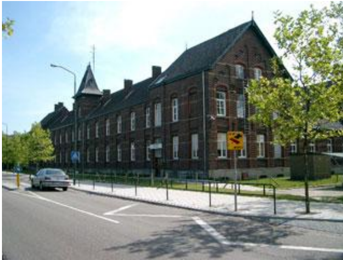
Afbeelding: het reusachtige Hotel St. Joseph, ofwel de Cantine uit 1898

Schoot was met ingang van 1917 een zelfstandige parochie geworden. In het rectoraat Budel-Dorplein werd in 1952 nog een nieuwe kerk gebouwd, toegewijd aan de H. Jozef.